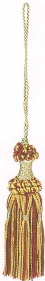
art. fiocco Madrid