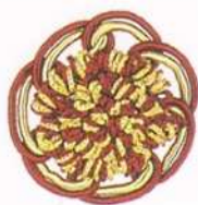
art. C rosetta