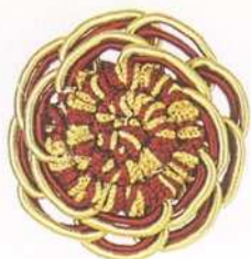
art. L2/P rosetta