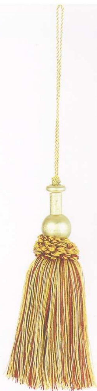
art. 2089 fiocco con legno