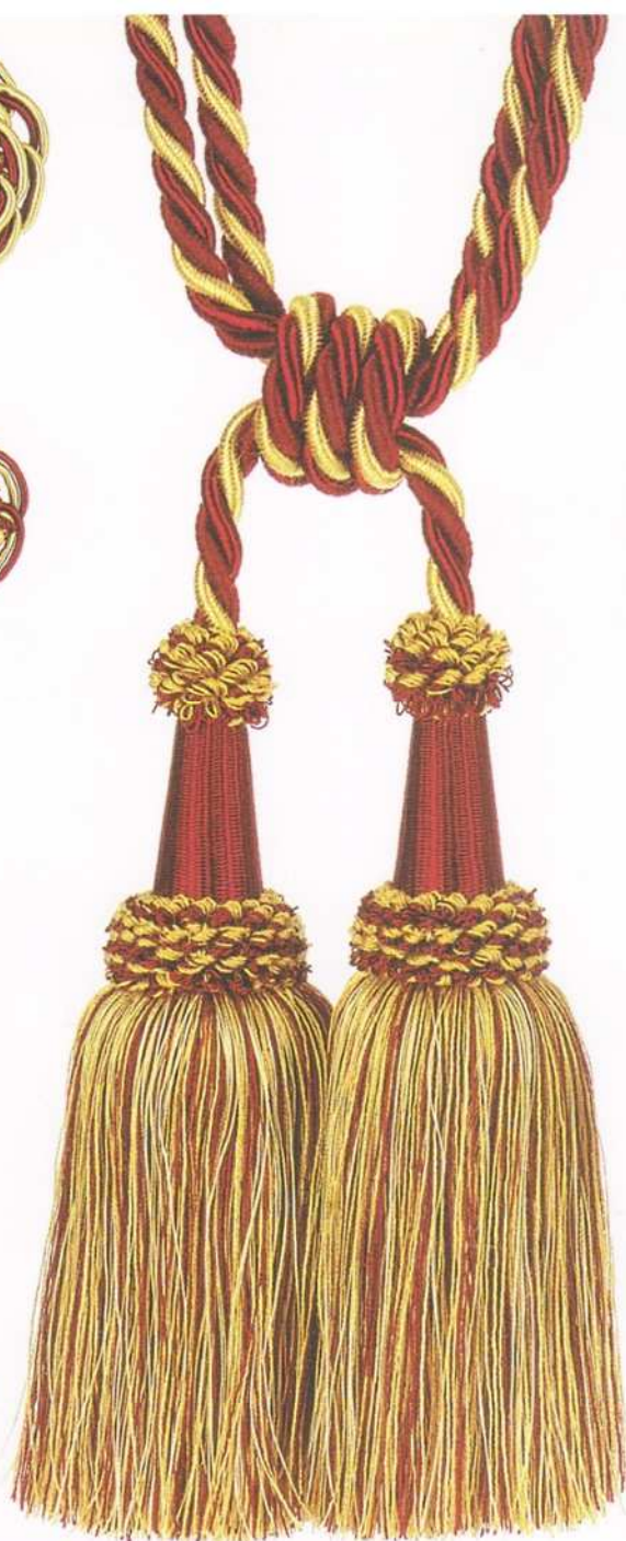
art. 2076 bracciale a due fiocchi