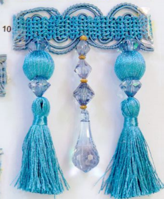
ARTICOLO 112 FRANGIA CM. 12