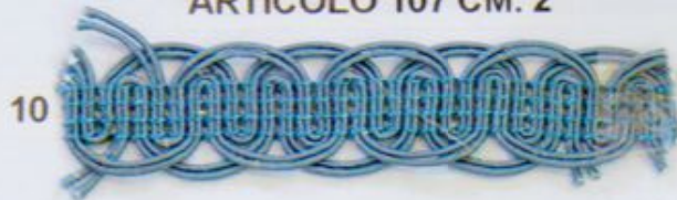
ARTICOLO 107 CM. 2