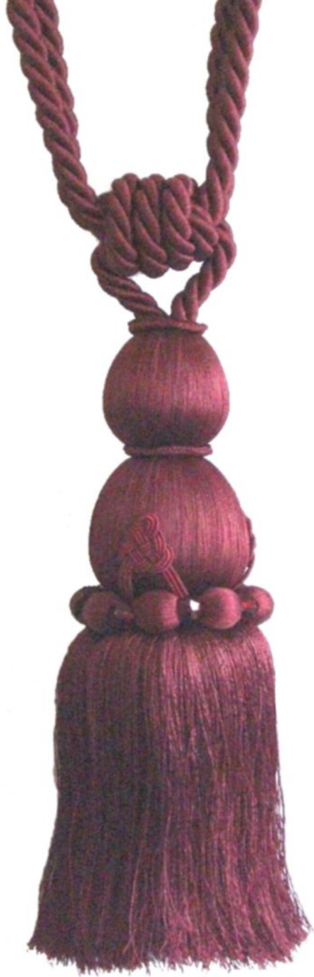
ART. B114 BRACCIALE CON PERLE