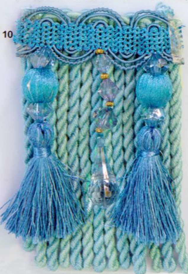
ARTICOLO 110 FRANGIA CM. 10

ART. 2539/15 FRANGIA POLTRONE con ART. 112 FRANGIA CON PERLE H.11,5